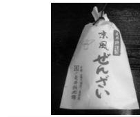
走井ぜんざい(レトルト) 400円