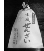
走井ぜんざい(レトルト) 400円